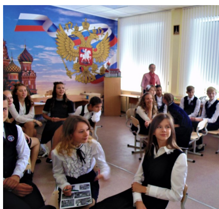
Учиться с увлечением—это для нас!

Все мы дружные, умные, часто шумные. Любим повеселиться и поиграть, но мы знаем, что учеба – наш главный труд. А наша гимназия – самая лучшая в мире!