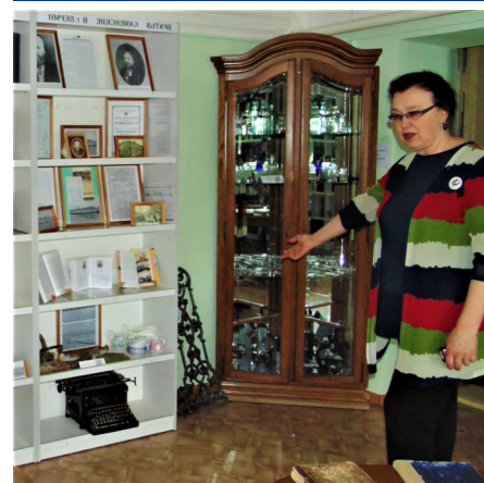
В Доме Каменских, в медицинской библиотеке (шоссе Космонавтов, 16) открылась новая экспозиция.