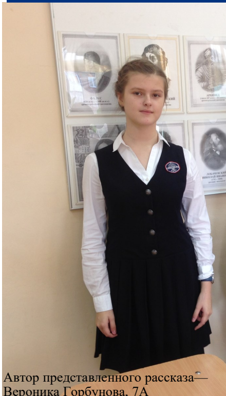
Автор представленного рассказа — Вероника Горбунова, 7А