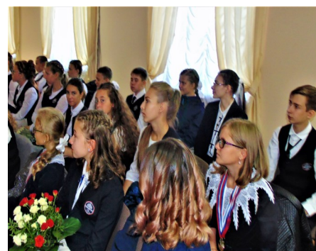
Гимназисты замерли в ожидании чуда. Или красивого взрыва.