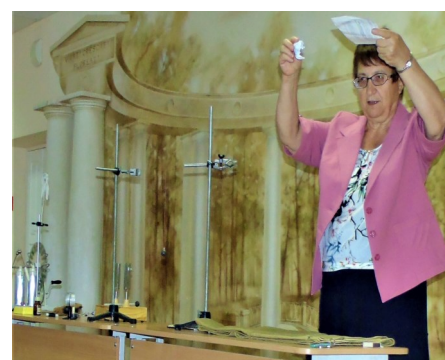
Сейчас, похоже, что-то будет!