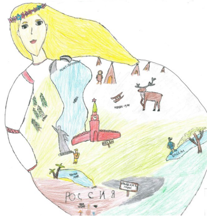
«Я - Россия! Я - гимназия!». Рис. Евы Воробьевой (12 лет)