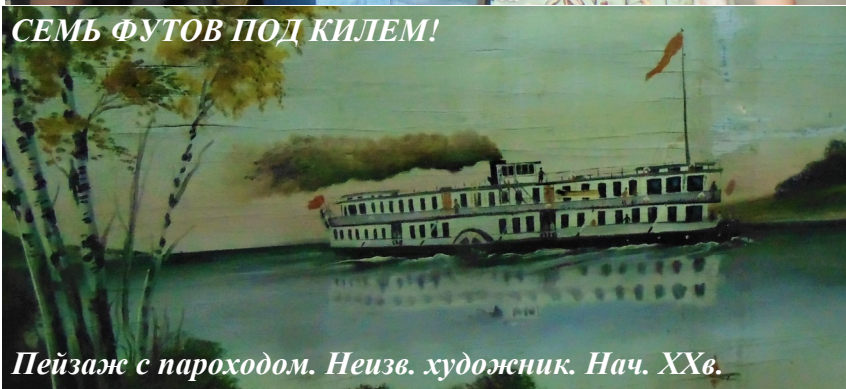
Пейзаж с пароходом. Неизв. художник. Нач. XXв.