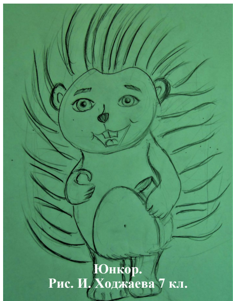
Юнкор. Рис. И. Ходжаева 7 кл.