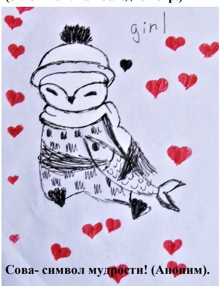
Сова- символ мудрости! (Аноним).